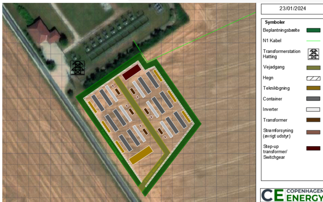
Figurtekst: Luftfoto af projektområdet

Projektområdet/det ansøgte fremgår af kort herunder.