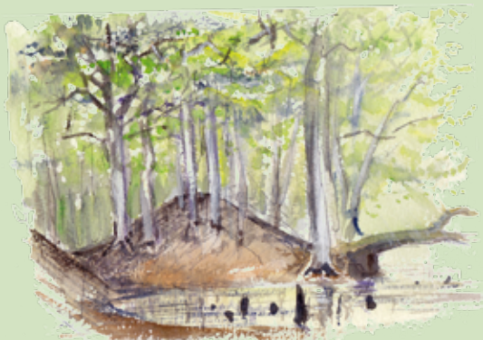
Vandhul i gammelt lergravsområde

Områdets små og store vandhuller er dannet, hvor der er blevet udgravet knolde af ler, der lå dybere i terrænet end de øvrige leraflejringer. I dag er vandhullerne vigtige levesteder for padder som salamandre, frøer og tudser. Særligt salamandre er afhængige af fiskefrie vandhuller i skovområder. Desuden yngler forskellige vandfugle i området og rådyrene benytter vandhullerne som drikkesteder.