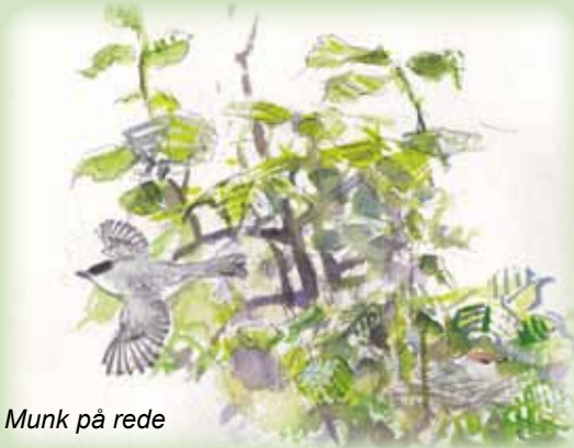
Munk på rede

I dag er det 5,89 ha store område fredeligt og naturskønt, et dejligt sted at gå en tur og levested for bl.a. rådyr, fugle og padder. De store bøgetræer i dalen blev plantet i 1928.