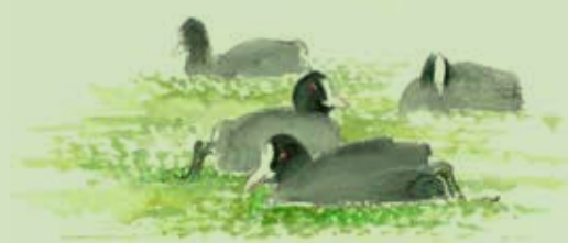
Blishøns i andemad