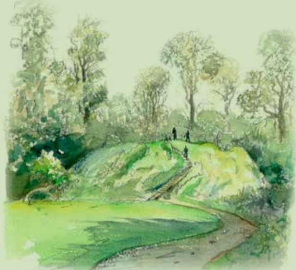
Slangebjerget og Ladegårdsplads

Slangebjergget har sit navn efter den snoede adgangsvej rundt om holmen.