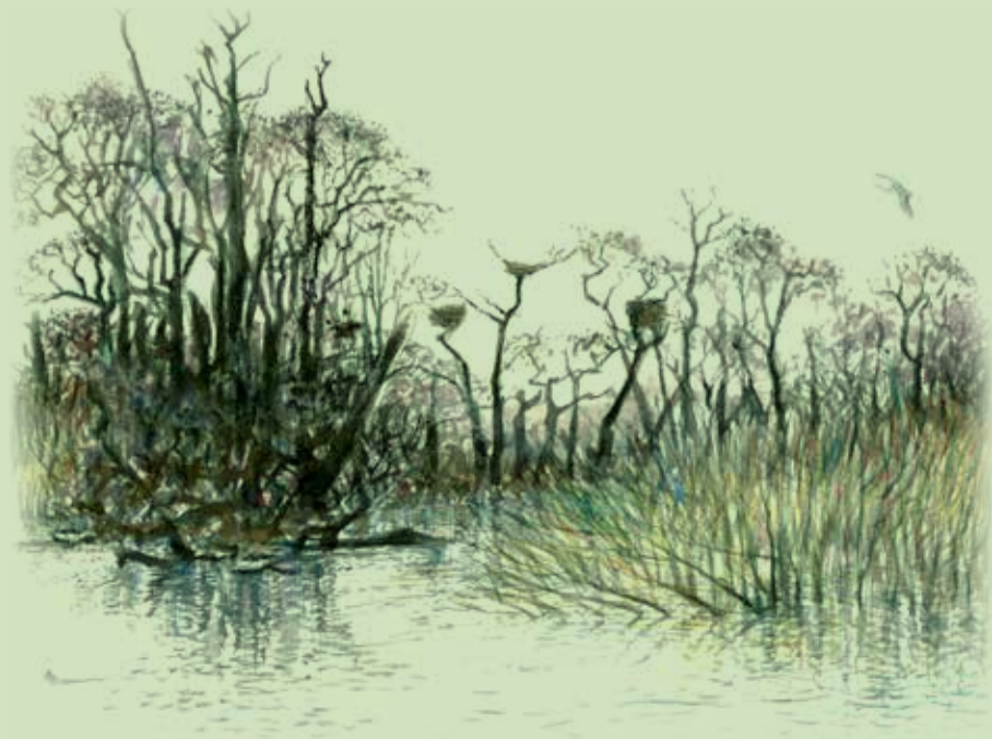
Hejrekoloni ved Bygholm Å

Gæs og ænder er så talrige, at Horsens Kommune i nogle år har reguleret andebestanden ved indfangning – da der blandt ænderne har været mange fejlfarver, og fuglene har nået et sådant antal at de forurener parken og dens vandmiljø.