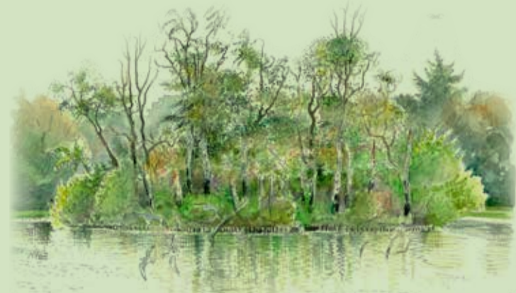
Øen i den sydligste store sø

Kun 200 m fra banegården og 600 m fra Horsens centrum ligger Bygholm Park – et frodigt park- og naturområde som udgør ca. 50 hektar. Området hvor parken ligger har tidligere været en del af et stort sumpet delta, skabt af Bygholm Å. Åen gennemløber stadig området og i parken er mange vådområder og søer, som tiltrækker et rigt fugleliv. Træbroer fører over søer og kanaler og giver mulighed for at opleve parken fra "søsiden". Området blev på Horsens Kommunes foranledning fredet i 1993 for at sikre parken som offentligt tilgængeligt rekreativt område og de kulturhistoriske interesser, der er knyttet til parken.