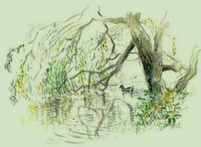
Rørhøne ved hængepil