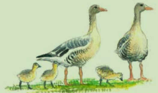
Grågæs med gæslinger

Øst for stryget lå i perioden 1935-41 en lille zoologisk have.