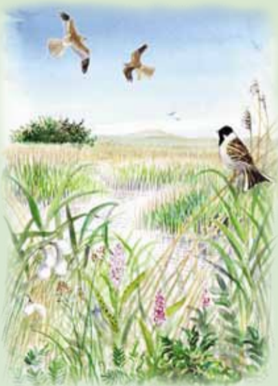
Rørhøg og Rørspurv

Du må tage din hund med, hvis den er i snor.