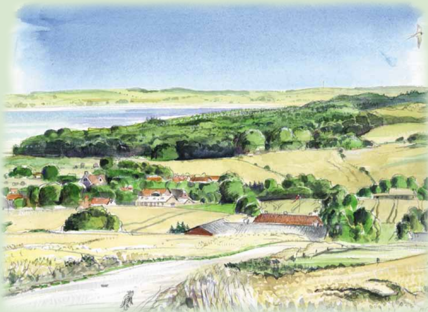
Udsigt nord for Haldrup mod vest

Gennem en effektiv rensning af byens spildevand er fjordens vandkvalitet blevet så god, at det "Blå Flag" hejses her.