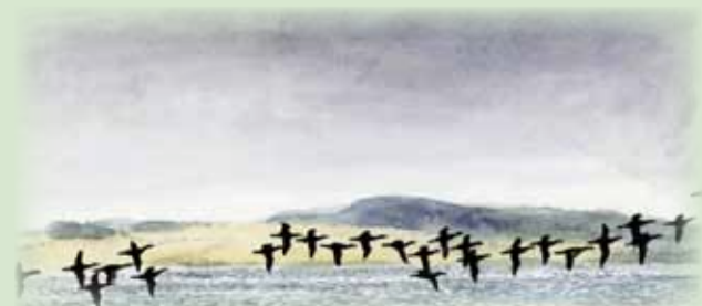
Skarver i flok

Der er anlagt en primitiv overnatningsplads med shelters ved Brigsted Strand.