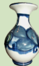
Vase fra Annashaab Iervarefabrik