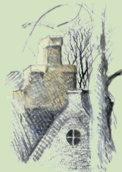
Hansted Kloster omgivet af store lindetræer