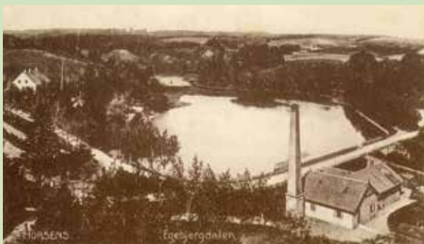
Egebjerg Vandværk set fra syd ca. år 1900

Dette vandværk fungerede i næsten 100 år, indtil det i 1971 blev erstattet af det moderne Højballegårdværk. Vandværket leverer ca. 68 % af drikkevandet til Horsens by. Der er i 2007 etableret en faunapassage. Umiddelbart nord for søen blev Lille Hansted Å ledt vest om søen, for at afskære søen for tilførsel af næringsstoffer. Nedenfor dæmningen blev der gravet et nyt vandløb på ca. 470 m.