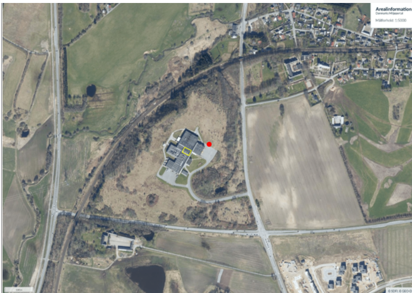
Figur 1. oversigtskort i målestok 1:5000.

Projektområdet/det ansøgte fremgår af kort herunder.