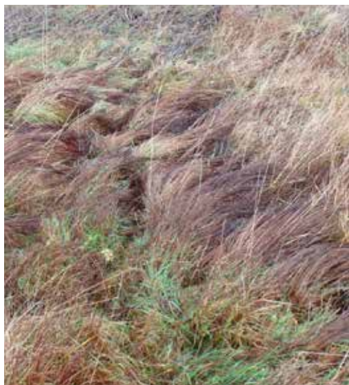
Fig. 1. Det er ikke altid let at se om et areal er beskyttet. Billedet viser en § 3-beskyttet eng.

Bemærk, at beskyttelsen og restriktionerne i anvendelse er præcis de samme, uanset om naturbeskyttelsen fremgår af kortene eller ej.