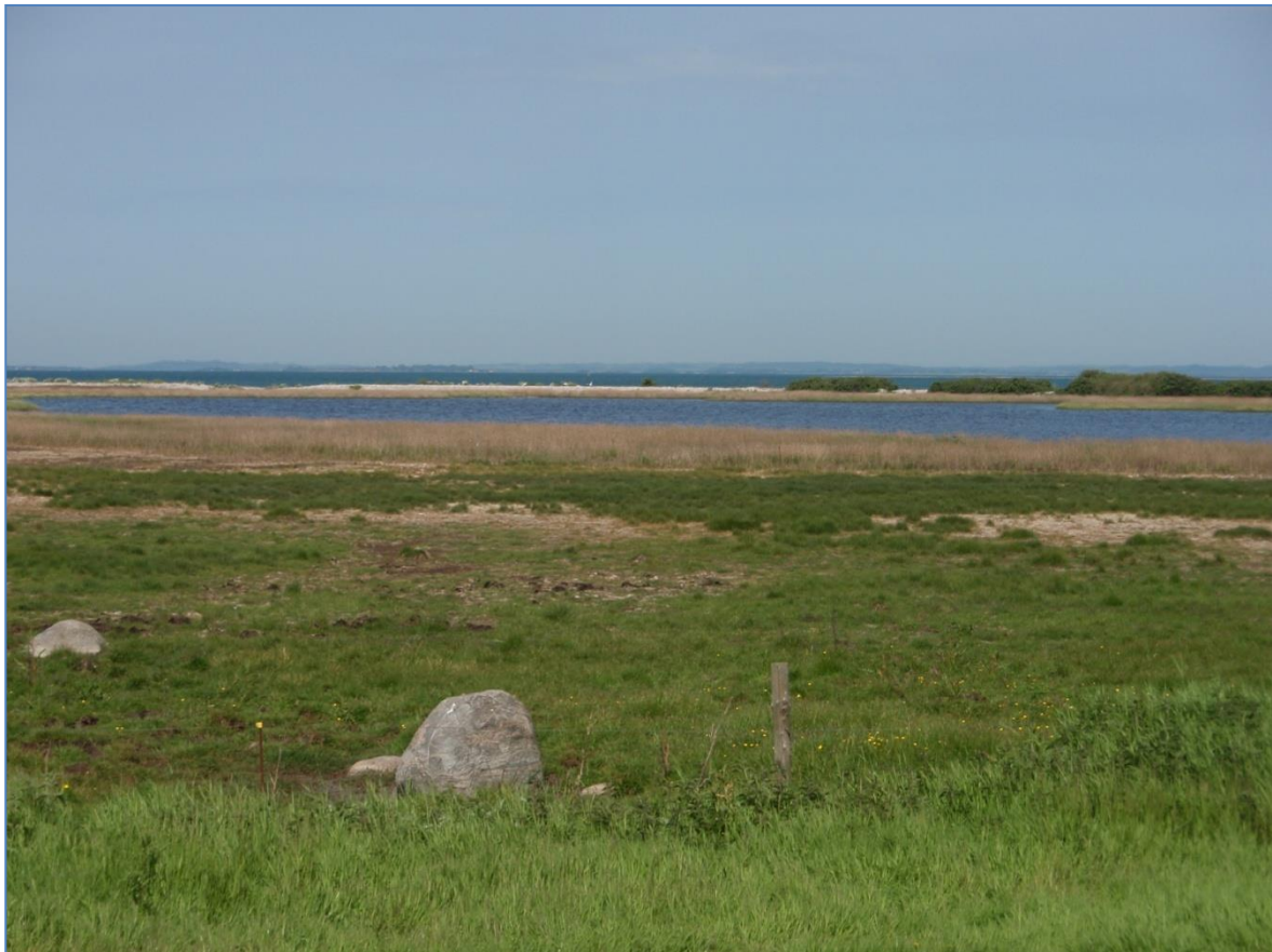
Havkig over habitatnaturtypen strandeng på Kloben.

**Hegn timer (nye hegn samt drift af eksisterende) og rydninger af uønsket opvækst (ud over invasive arter).