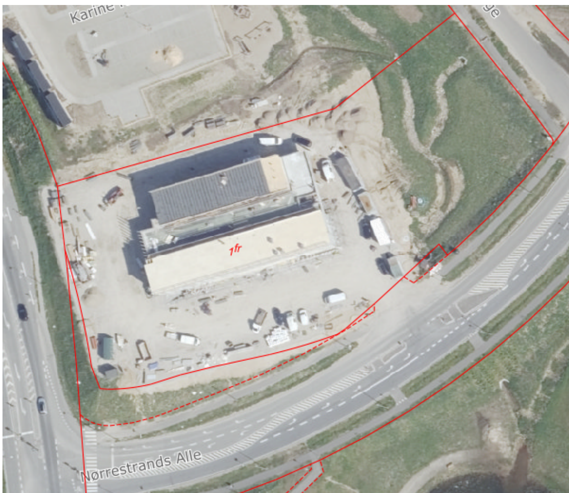
Figur 1: oversigtskort over Nørrestrands Alle 1, 8700 Horsens. Matrikelgrænse er optegnet med rødt

I forbindelse med opførelse af dagligvarebutik og 12 boliger på Nørrestrands alle 1, 8700 Horsens, matr.nr. 1fr Hansted Hgd., Hansted er der ansøgt om tilladelse til tilslutning af regnvand fra matriklen.