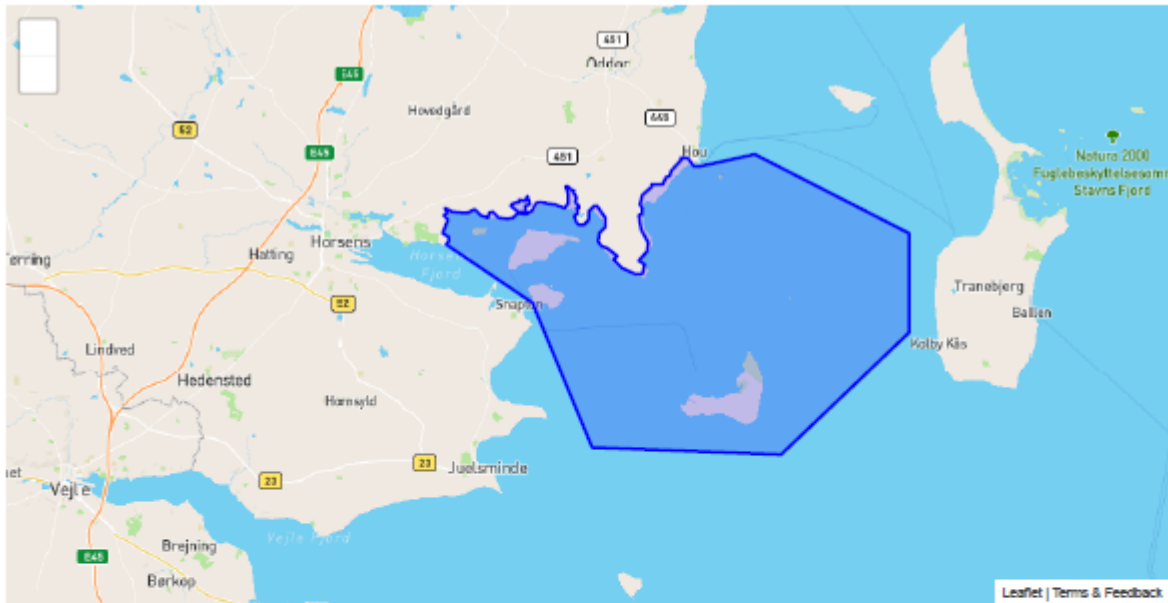
Tabel A: Kortlagte naturtyper på Naturstyrelsens arealer i Natura 2000-området