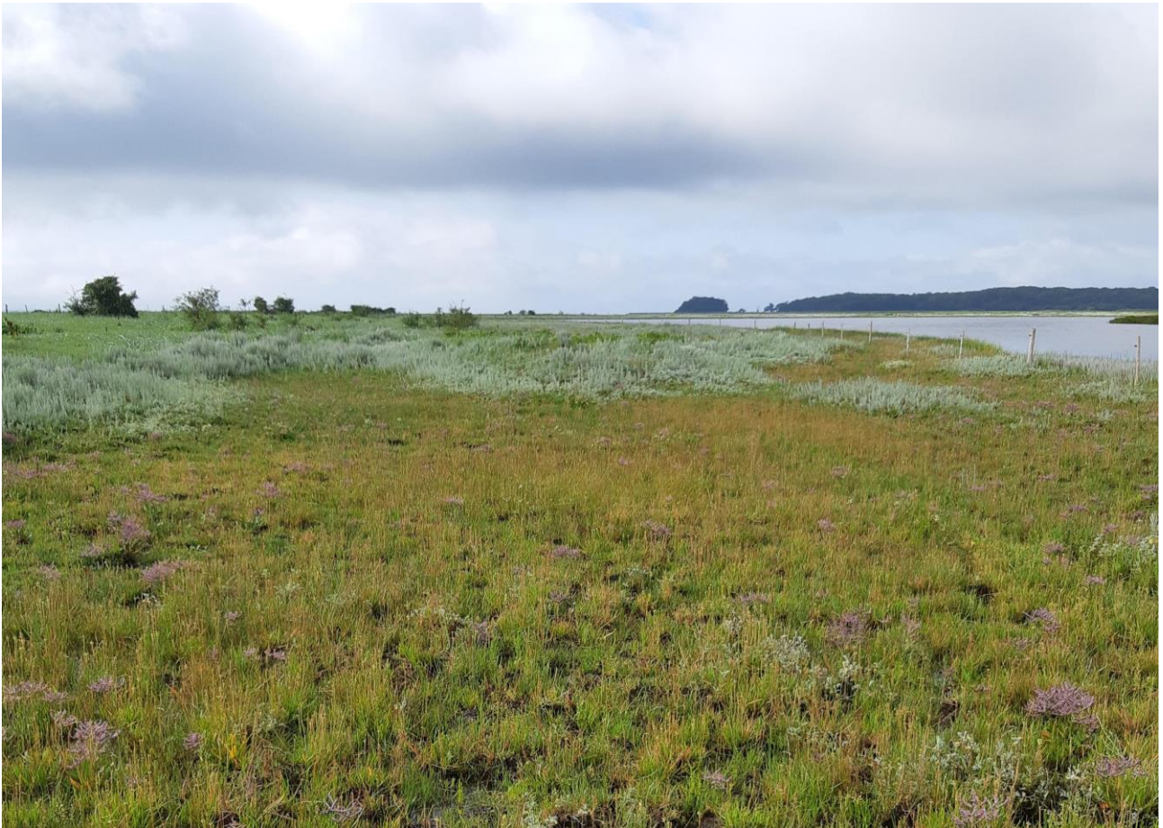
Afgræsset strandeng (1330) i Odder kommune med bl.a. lav hindebæger. Naturtypen strandeng udgør over halvdelen af den lysåbne habitatnatur i Natura 2000-området N56 Horsens fjord, havet øst for, og Endelave. Odder kommune.

Odder Kommune har opsat færdsel forbudt skilte på Alrø, v. holmene. Skiltene er opsat således at færdsel i fuglenes ynglesæson reguleres bedre. Odder kommune har desuden opsat vildtkameraer på holmene, for at kortlægge omfanget af prædation på ynglelokaliteterne.