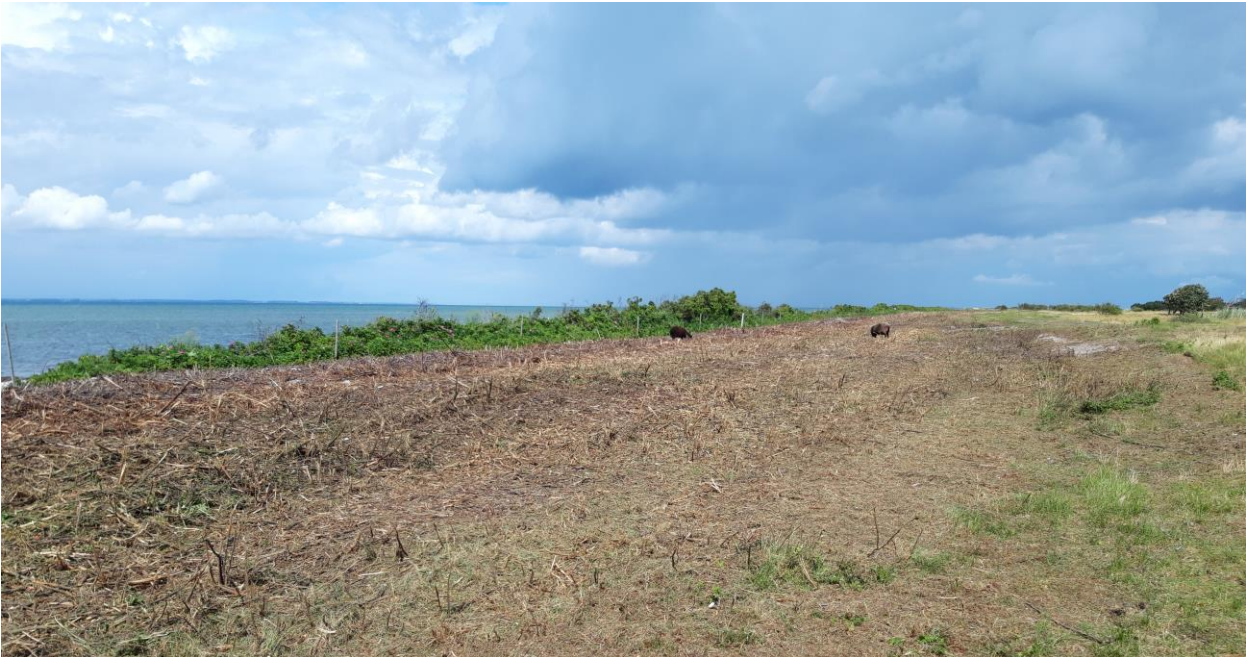
Knusning af rynket rose med efterfølgende afgræsning med gutefår og shetlandsponyer på Øvre. Horsens Kommune.

Effekten af indsatserne bliver løbende vurderet i det Nationale Overvågningsprogram for Vandmiljø og Natur (NOVANA), som overvåger vandmiljøets og naturens tilstand inden for de områder, der prioriteres i forhold til de politisk fastsatte økonomiske rammer.