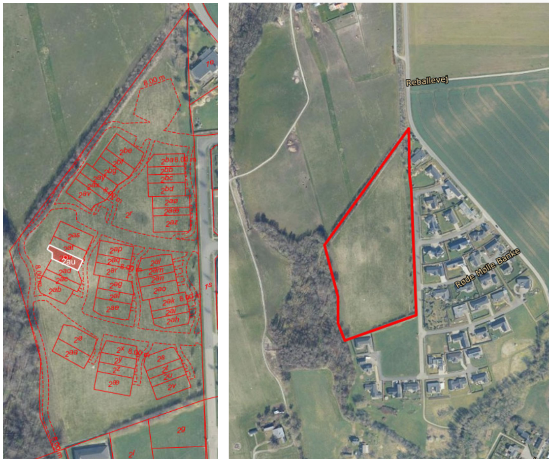
Figur 1. Kort til venstre: Oversigtskort over Røde Mølle Banke. Matrikel 2au Ørbæk By, Søvind er markeret med hvid. Matrikelgrænser for de øvrige boligparceller og fællesareal er markeret med rødt. Billede til højre: Projektarealet indrammet med rødt.

I forbindelse med byggeri af bolig på Røde Mølle Banke 9C, 8700 Horsens, matr.nr. 2au Ørbæk By, Søvind er der ansøgt om tilladelse til tilslutning af regnvand fra matriklen. Byggeriet er en del af større byggeprojekt, hvor der etableres 42 boliger i form af rækkehuse fordelt i 13 klynger.