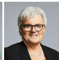
Birthe Knudsen Socialdemokratiet Næstformand