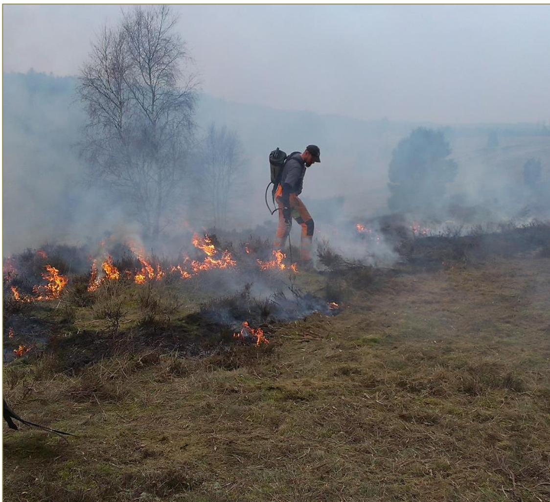
Hedeafbrænding syd for Salten Langsø, Horsens Kommune

Natura 2000-planen for Salten Å, Salten Langsø, Mossø og søer syd for Salten Langsø og dele af Gudenå beskriver de konkrete mål for indsatsen. Naturtyper og arter på udpegningsgrundlag fremgår af Natura 2000-planen. På baggrund af dette har kommunen vurderet, at der er behov for nedenstående konkrete forvaltningstiltag. Hvor igangsatte indsatser fra handleplanen for planperioden 2010-2015 ikke er gennemført i sin helhed, indgår den udestående indsats i opgørelsen over behovet for konkrete forvaltningstiltag.