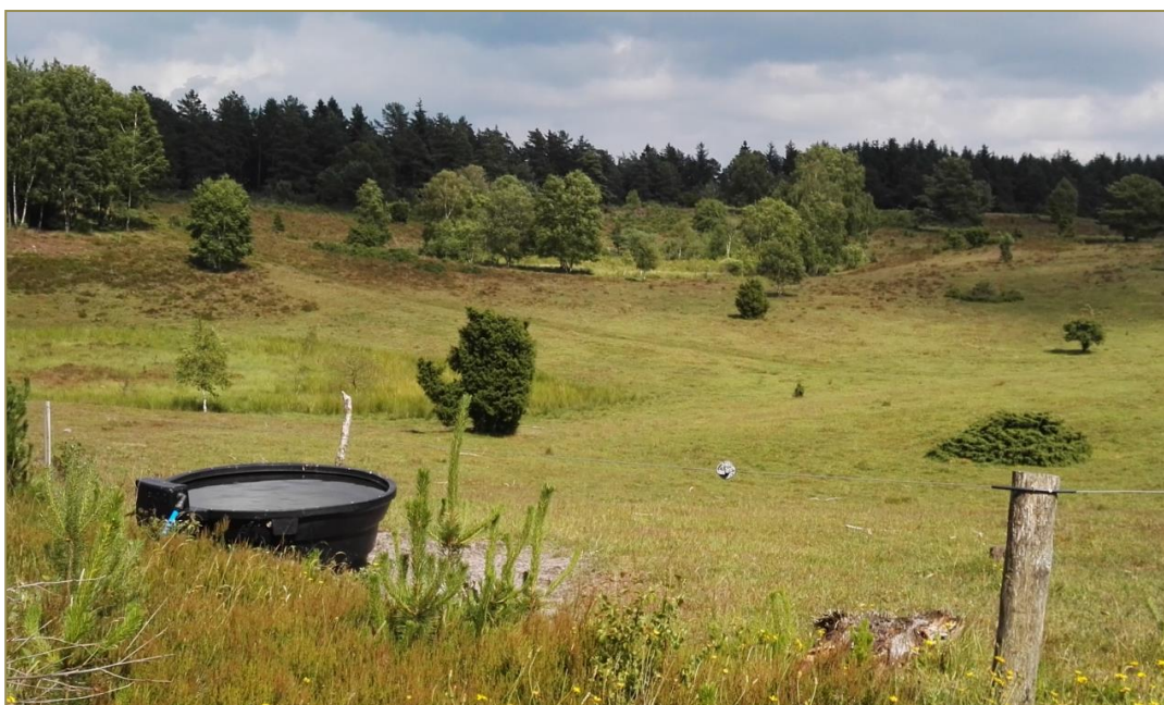
Græsningsfold syd for Salten Langsø

En af de vigtigste indsatser i planperioden er iværksættelse af udvidelse af de eksisterende driftsenheder, så nye arealer inddrages i pleje. Sidstnævnte indsats skal både sikre udvikling af Ny Habitatnatur, og også en sammenbinding af de lysåbne naturarealer til større og mere robuste driftsenheder.