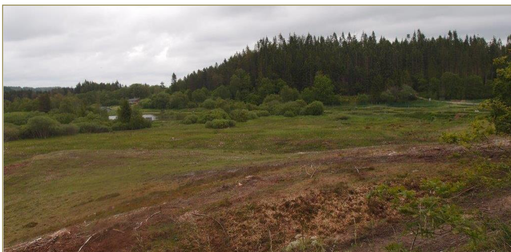
Nyt rigkær ved Vrads – foto Silkeborg Kommune

Projekterne gennemføres ved frivillige aftaler, og derfor er det i mange tilfælde ikke på nuværende tidspunkt muligt at beskrive hvornår projekterne fysisk bliver udført. Kommunen vil i hvert enkelt tilfælde sørge for, at relevante interessenter bliver inddraget.