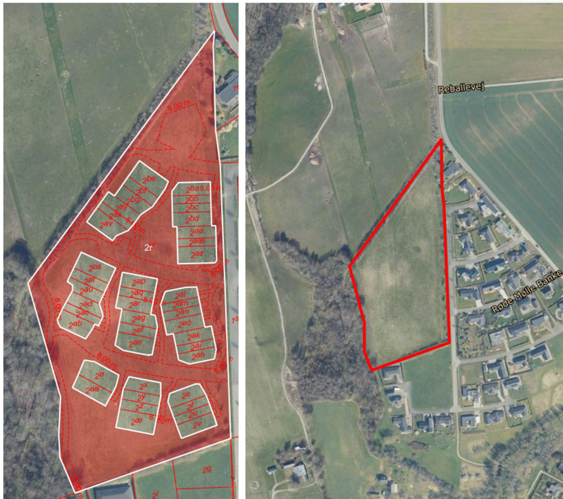
Figur 1. Kort til venstre: Oversigtskort over Røde Mølle Banke. Matrikel 2r Ørbæk By, Søvind er markeret med rødt. Matrikelgrænser for de øvrige boligparceller og fællesareal er markeret med hvidt. Billede til højre: Projektarealet indrammet med rødt.

I forbindelse med opførelse af et boligprojekt på Røde Mølle Banke, 8700 Horsens er der ansøgt om tilladelse til tilslutning af regnvand fra matrikel 2r, Ørbæk By, Søvind. Byggeriet er en del af et større byggeprojekt, hvor der etableres 42 boliger i form af rækkehuse fordelt i 13 klynger. Matr.nr. 2r, Ørbæk By, Søvind omfatter bl.a. veje, parkeringsarealer og grønne områder.