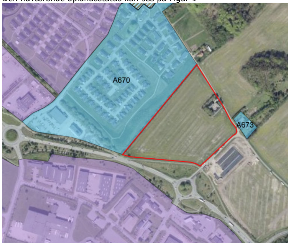
Figur 2: Spildevandsplanens status for området. Projektområdet, der er indrammet med rødt, er ikke omfattet af den gældende spildevandsplan.

Projektområdet er ikke omfattet af Horsens Kommunes Spildevandsplan 2012- 2015. Den nuværende oplandsstatus kan ses på Figur 1