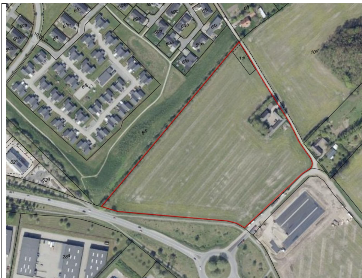
Figur 1: afgrænsning af projektområdet, der skal optages i Horsens kommunes spildevandsplan

Tillæg nr. 90, nyt separatkloakeret opland