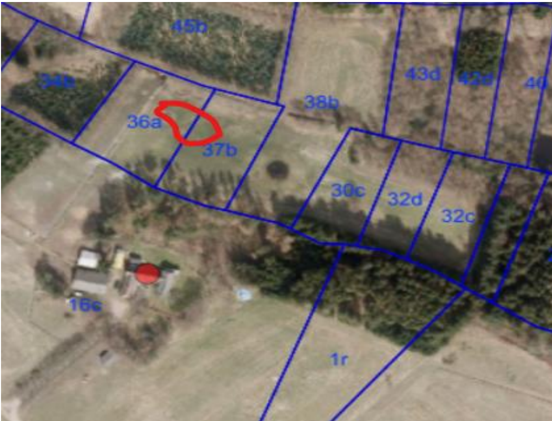
Flyfoto 2010 © Hexagon. Området, hvor vandhullet ønskes etableret, er markeret med rødt.