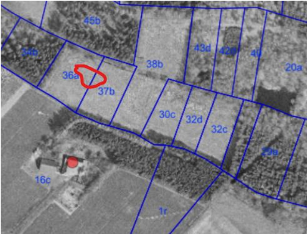
Flyfoto 1990 ©JO informatik. Området, hvor vandhullet ønskes etableret, er markeret med rødt.