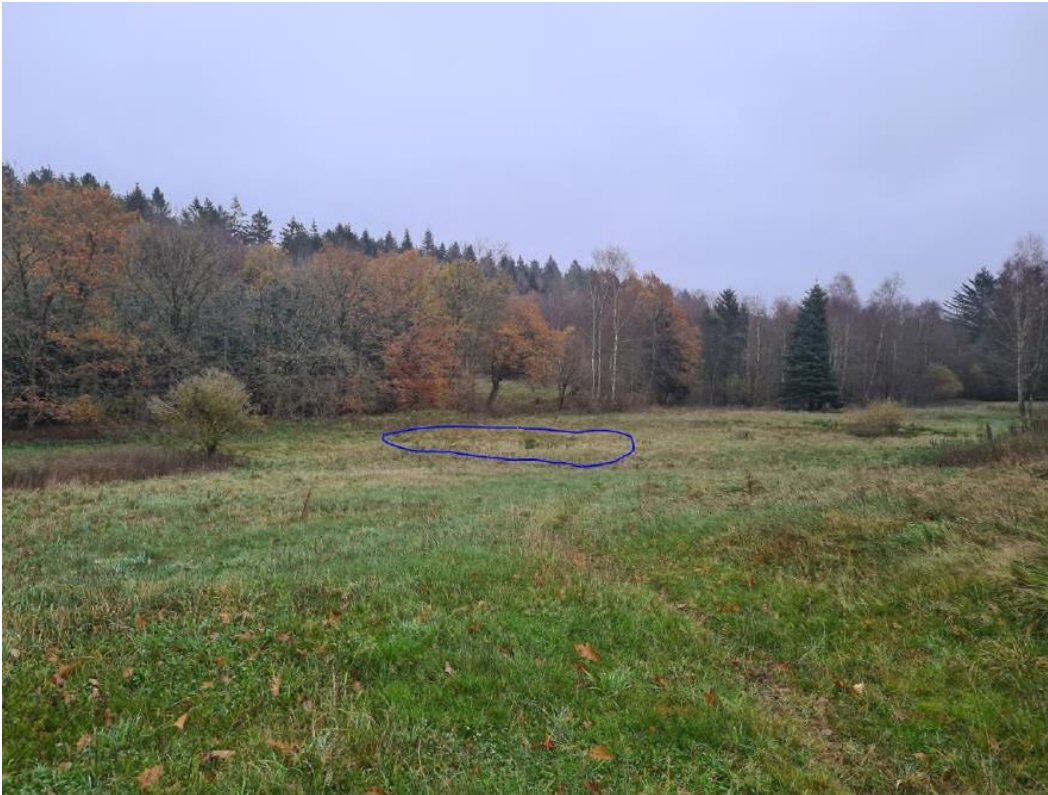
Figur 1. Det beskyttede engareal er domineret af græsser og en mindre del af urter, den blå ring markerer placeringen af vandhullet.