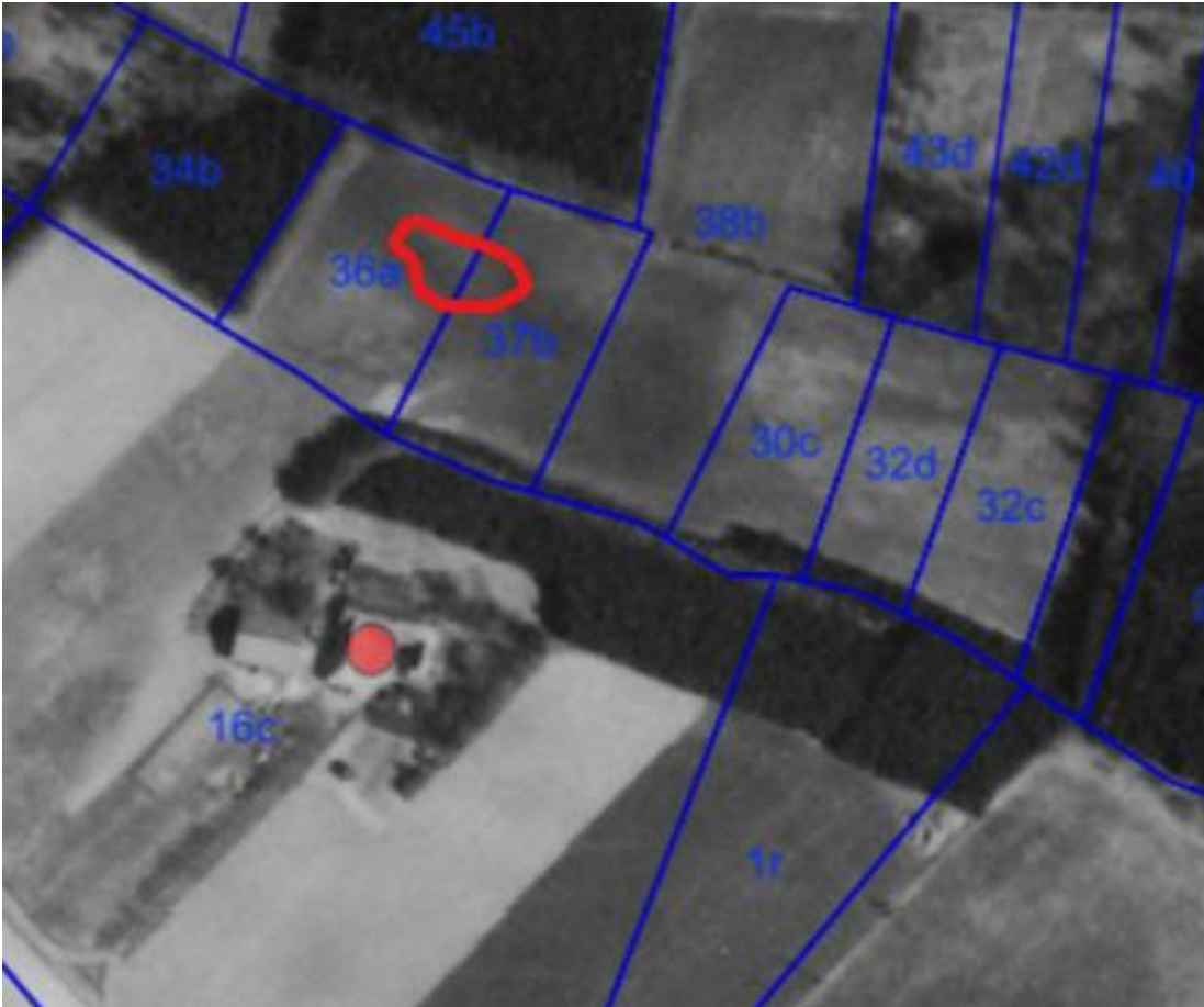
Figur 2 Flyfoto. Området, hvor vandhullet ønskes etableret, er markeret med rødt.