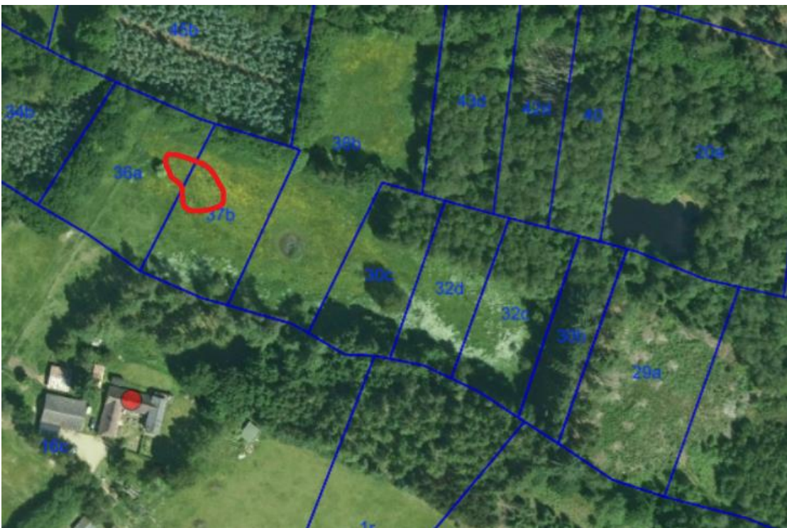
Flyfoto 2020 © Hexagon. Området, hvor vandhullet ønskes etableret, er markeret med rødt.