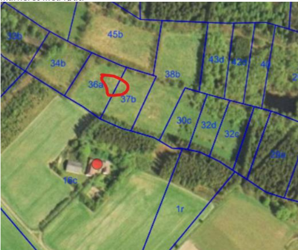
Flyfoto 1999. Området, hvor vandhullet ønskes etableret, er markeret med rødt.