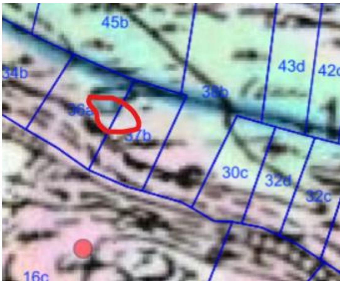
Høje målebordsblade 1842-1899 Området, hvor vandhullet ønskes etableret, er markeret med rødt.