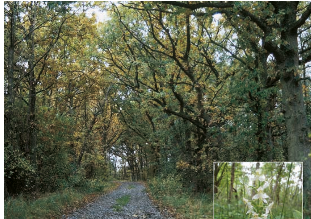
Skov-gøgeilje er knyttet til løvskove og krat