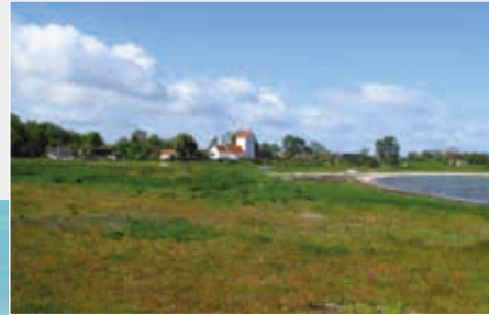
Udsigt til badestrand og kirke.

I byen findes stadig en række butikker og servicefunktioner, der dækker øboernes daglige fornødenheder - købmand, posthus, bibliotek, campingplads og gæstgiveri.