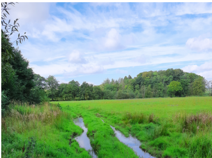
Placering af vandhul 3