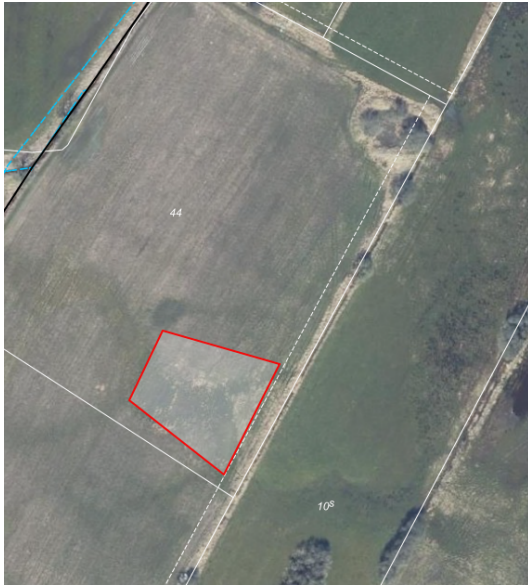
Figur 4. Luftfoto forår 2023. Placering af nyt vandhul 2 indenfor rød streg, sydlig ende af matr. 44 , Grumstrup by, Vedslet markeret med "2" på oversigtskort ovenfor.