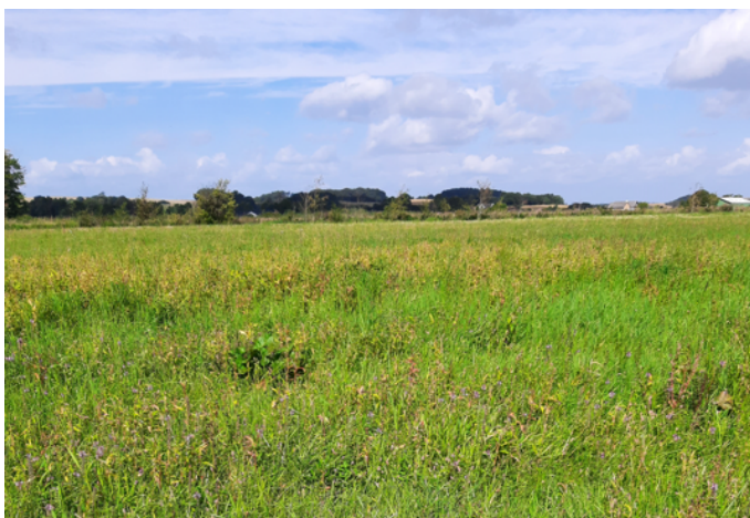
Placering af vandhul 2