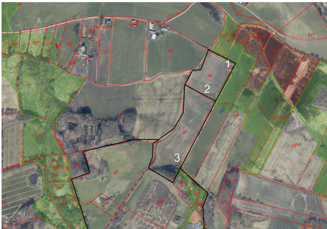
Figur 2. @GeoDK. Luftfoto forår 2023. OVERSIGTSKORT. Matr.nr. 44 og 5c, Grumstrup by, Vedslet på ejendommen Engmosevej 2 tilhørende ejer af Engmosevej 5. Placering af nye vandhuller samt udvidelse af eksisterende. Se detailkort nedenfor.

Lodsejer ønsker at skabe mere natur i området og ønsker derfor at etablere to nye vandhuller. Derudover ønsker han at oprense og udvide et eksisterende vandhul. Selve oprensningen af det eksisterende vandhul kræver en dispensation efter naturbeskyttelseslovens § 3, og behandles derfor i en særskilt tilladelse. I nærværende afgørelse behandles således kun de to nye vandhuller samt udvidelsen af det eksisterende , se nedenstående figur 2.