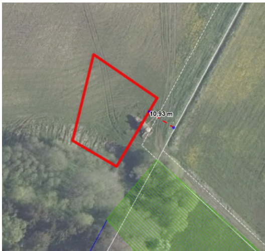
Figur 5. Luftfoto forår 2023. Placering af nyt vandhul 3 indenfor rød streg, sydlig ende af matr. 5c , Grumstrup by, Vedslet markeret med "3" på oversigtskort ovenfor.

Vandhul 1: Det eksisterende vandhul i nordøstlig hjørne af matr.nr. 44 udvides til ca. dobbelt størrelse mod sydvest.