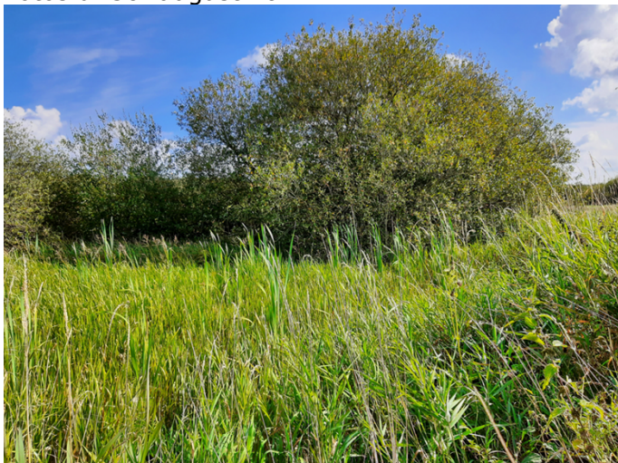
Vandhul 1, som skal oprensnes og udvides