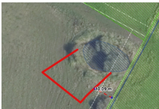
Figur 3 @GeoDK. Luftfoto forår 2023. Udvidelse af eksisterende vandhul 1 indenfor rød streg. Placering i nordlige ende af matr.nr. 44 , Grumstrup by, Vedslet markeret med "1" på oversigtskort ovenfor.