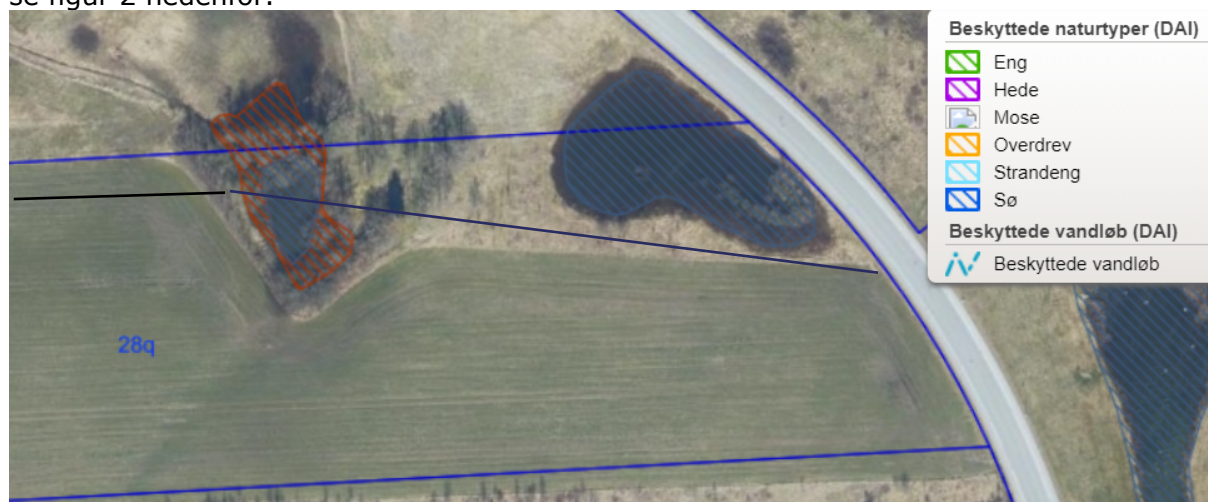
Figur 2. Luftfoto 2023, Copyright SDFI. Udstrækning af beskyttet natur. Styret underboring – trace angivet med sort streg (ikke målfast)

Den ansøgte underboring krydser et vandhul, der ligger på tværs af matrikelskel, og som derfor har interesse for flere end en. Dermed er vandhullet omfattet af vandløbsloven. Vandhul og omkringliggende areal er beskyttet af naturbeskyttelseslovens §3. for udstrækning se figur 2 nedenfor.