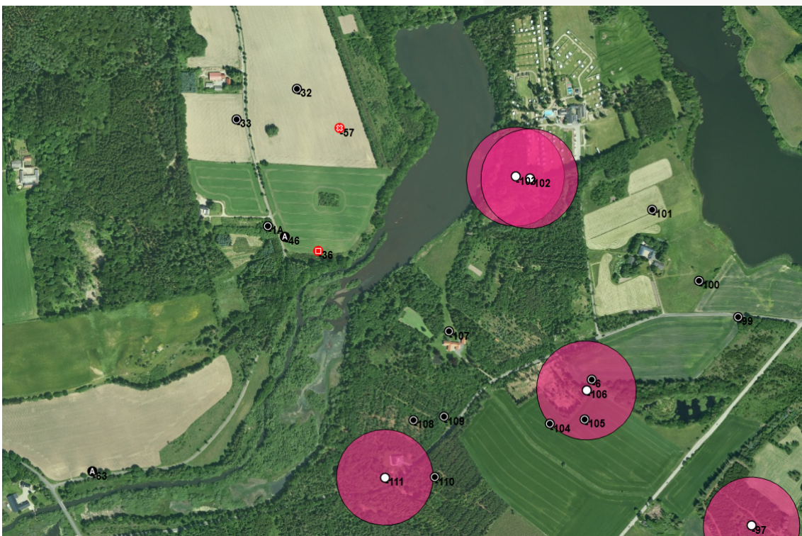
Oversigt over registrerede fortidsminder i området.