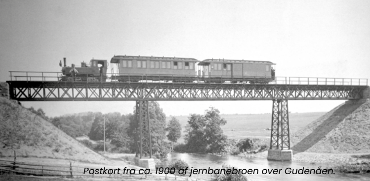
Postkort fra ca. 1900 af jernbanebroen over Gudendåen.