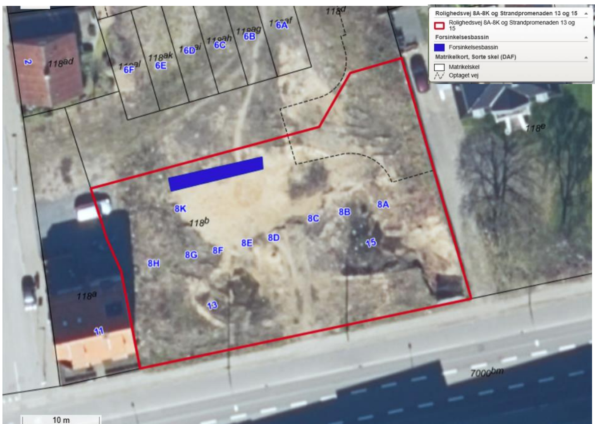
Figur 1: Rolighedsvej 8A-8K og Strandpromenaden 13 og 15, 8700 Horsens er markeret med rød linje. Forsinkelsesbassin er markeret med blå.

Pilea har den 17. juni 2024 søgt om tilladelse til tilslutning af regnvand for Rolighedsvej 8A-8K og Strandpromenaden 13 og 15, 8700 Horsens.