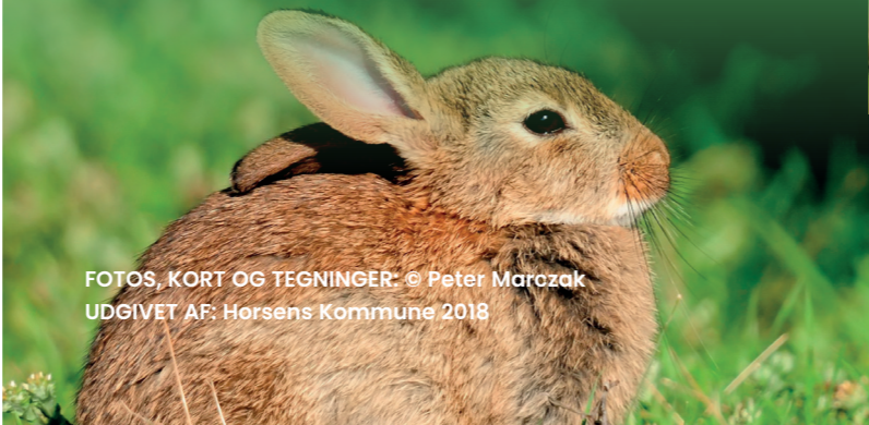
FOTOS, KORT OG TEGNINGER: © Peter Marozak UDGIVET AF: Horsens Kommune 2018

Den europæiske vildkanin er stamfader til tamkaninen, og selv efter mange hundrede års fangenskab, adskiller vildkanin og tamkanin sig ikke væsentligt fra hinanden. Den europæiske vildkanin kommer sandsynligvis oprindeligt fra den liberiske Halvø, hvorfra den har bredt sig til Vest- og Centraleuropa. Danmark og Sydsvrige er nordgrænsen for kaninernes naturlige udbredelse.