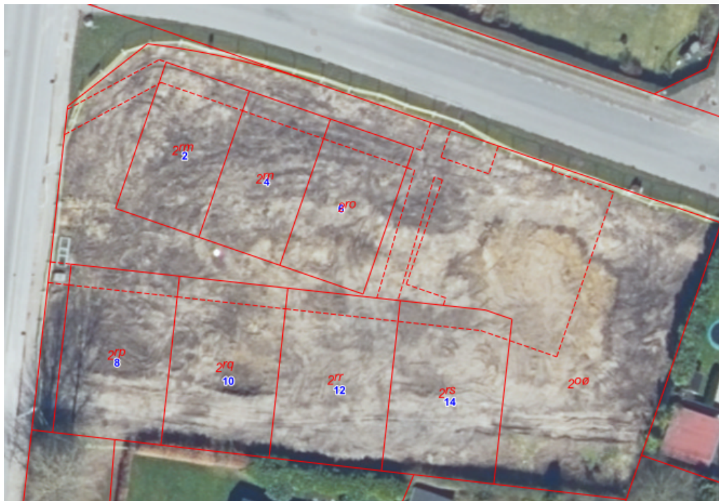
Figur 1. Fællesareal for ejendommene Herregårdsparken 2-14, 8700 Horsens. Matr.nr. 200 Stensballegård Hgd., Vær. Matrikelgrænse er markeret med rødt.

Matriklen har et areal på 1520 m 2 . Det tilladelige afløbstal for matriklen er på den baggrund beregnet til 5,47 l/s. ( (1520 \text{ m}^2 \times 0,30) / 10.000 ) x 120 l/s/red. Ha). Det tilladelige afløbstal skal overholdes for at sikre kloaksystemet mod, at der ledes for store mængder regnvand til, da det kan medføre overbelastning af regnvandsledningen og det nedstrøms liggende regnvandssystem.