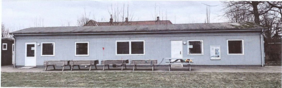
VRØNDING KLUBHUS, SØR MOLBERVEJ 45. 8700 Horsens