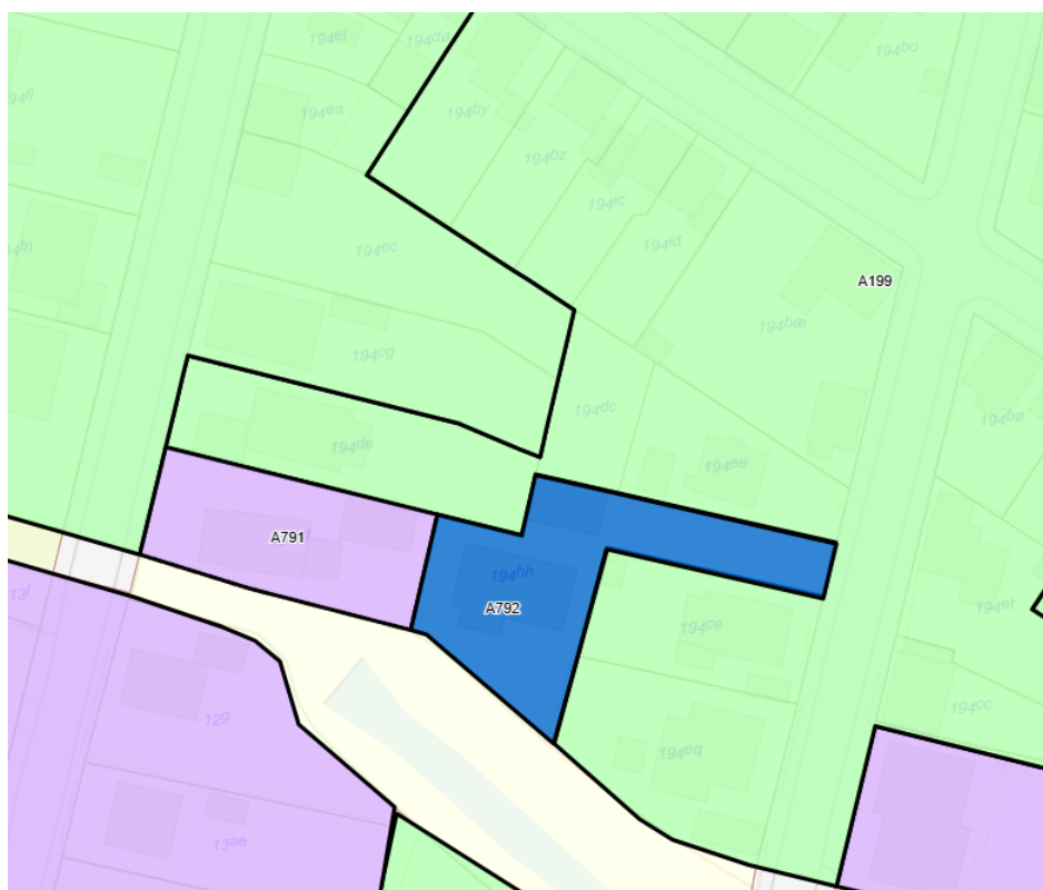
Figur 2: Områdets fremtidige status jf. spildevandsplan.