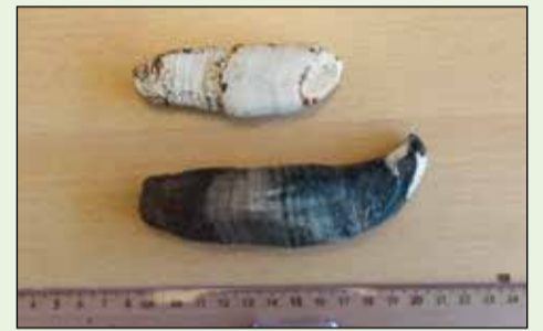
Tænder fra spækhugger fundet ved punkt nr. 18.