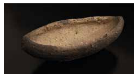
Tranlampe. Lampen fyldes med spæk og en lille væge antændes