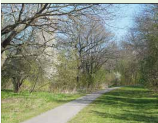
Bryrupbanestien ved golfbanen.

Sidst i 1700-tallet begyndte bønderne at dræne engene, det gav flere græsningsarealer og engområder til høslet. Samtidig blev engene brugt til tørvegravning.