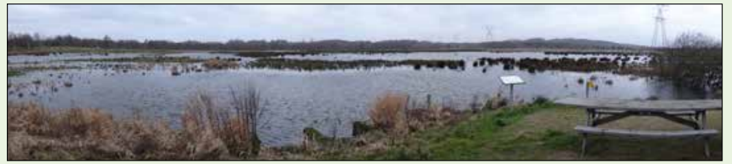
Udsigt over Bygholm Enge fra det gamle pumpehus i januar 2013.

Enge, er der ved Skanderborgvej fundet spor efter boelse med langhuse. Husene er fra slutningen af bondestenalderen og ældre bronzealder, 2.000-1.200 f.Kr. Nord for Sorthøjvej er et område med gravhøje og brandgrave.