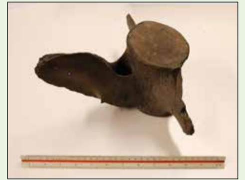
Hvalknogle fundet under arkæologisk udgravning tæt ved pumpehuset nr. 17.