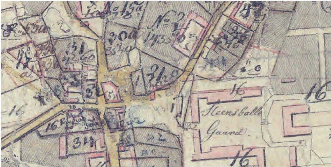
Original 1-kort 1817