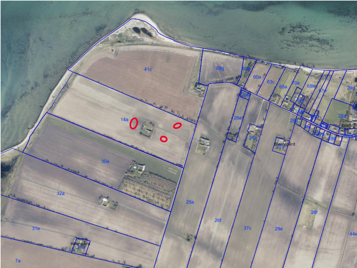
Luftfoto 2023. Oversigtskort over området. Den omtrentlige placering af de tre vandhuller på ejendommen Vesterby 74 er markeret med røde cirkler.