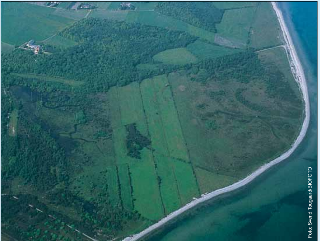
Det store naturområde ved Lynger med øens største løvskov byder på en afvekslende natur og mange spændende turmuligheder.

Et forslag til en vandretur går fra Endelave By til stranden ved Klinten, som på sine højeste steder er omkring 5 meter høj. Herfra er en meget smuk udsigt i klart vejr til både Æbelø, Fyn og Jylland. Følges kysten mod øst, forbi sommerhusområdet, kommer man til Lynger - det andet af Endelaves store naturarealer afvekslende med skov, hede og engområder. En række stier og veje fører rundt i området. Retur igen langs stranden eller ad Lyngervej over midten af øen. En tur på ca. 11 km.