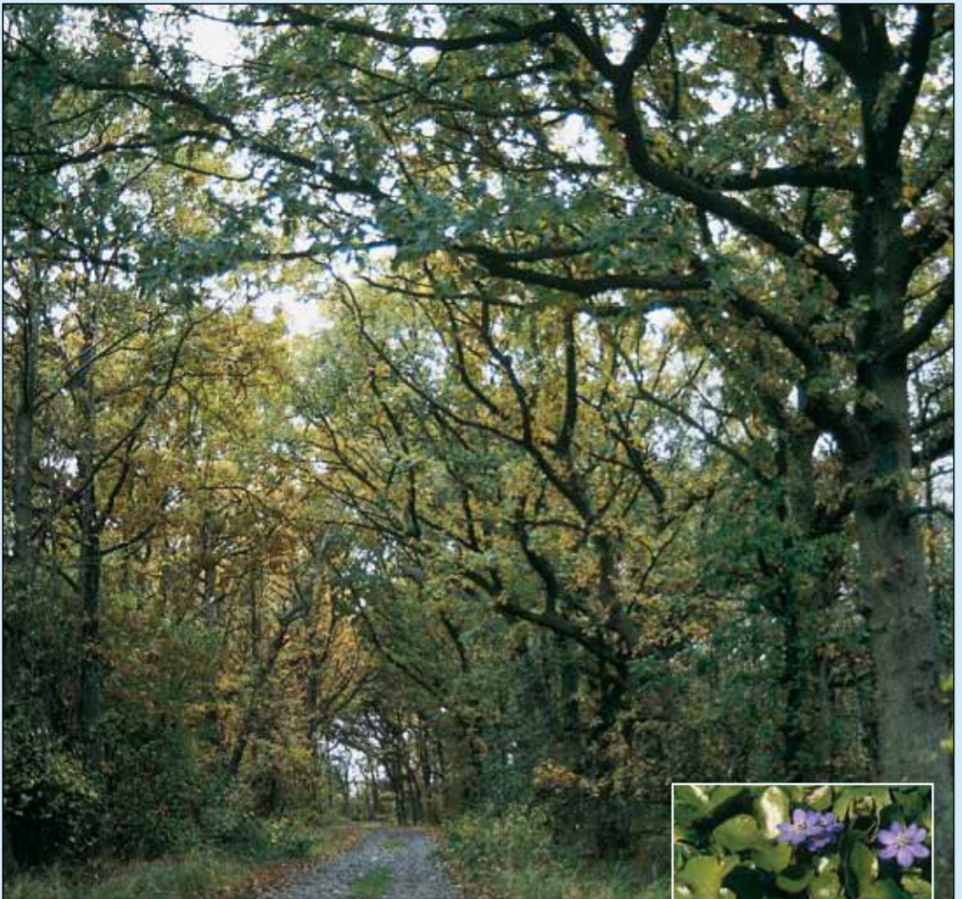
Skoven ved Louisenlund kaldes også for "Troldskoven" på grund af træernes mange sjove og krogede former.