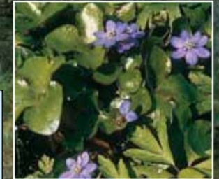
Skovbunden er rig på blomster, bl.a. blå anemone.

Endelaves natur er bemærkelsesværdig, og rummer en mangfoldighed af forskellige naturtyper. De centrale dele af øen er agerjord, mens henvend en trediedel består af uopdyrket og forholdsvis uforstyrret natur. Foruden det 300 tdr. land store fredede naturområde ved Øvre, er der et andet stort sammenhængende naturområde ved Lynger Hage i syd med lynch og blandet bevoksning af fyr, eg, birk og rønnebær.