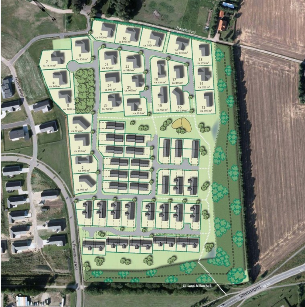
Bilag 1: Oversigtskort over fremtidige forhold inden for lokalplan 2016-16